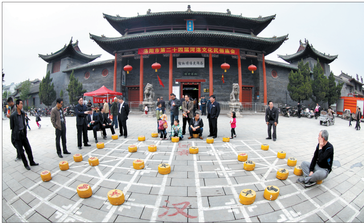
巨型象棋棋子吸引众人目光