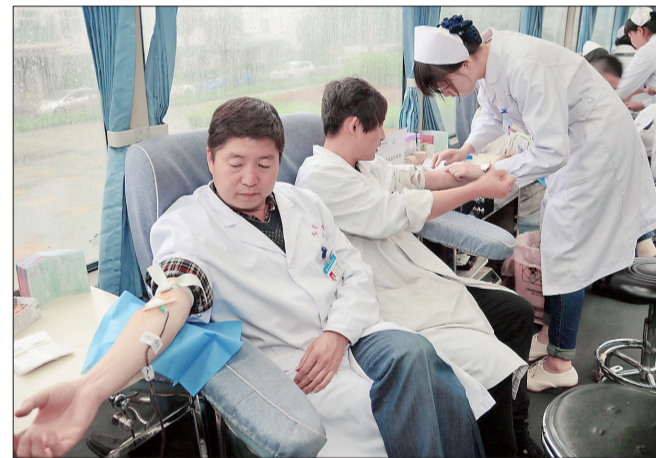
昨日上午,洛阳荣康医院的101名医护人员进行集体义务献血,共计献血4万多毫升,以实际行动增强我市的血液保障能力,向社会奉献爱心。该院成为我市首批参加无偿献血的文明单位之一。

此外,在昨日的签约仪式上,香港路劲御城科技城市综合体项目、汇智科技园项目等11个项目同时签约,本次签约项目总投资达169.5亿元。