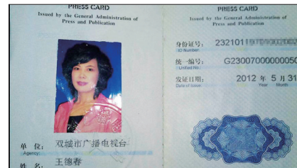
女主播网上出示记者证实名举报