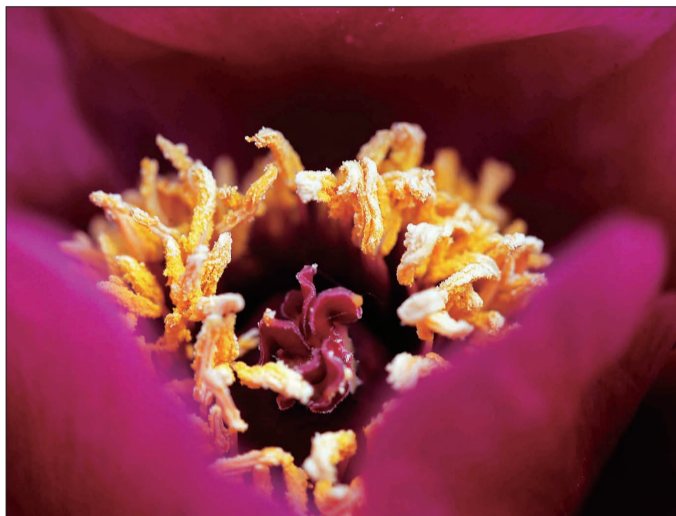
在相机微距拍摄下，冠世墨玉的花蕊金灿灿的