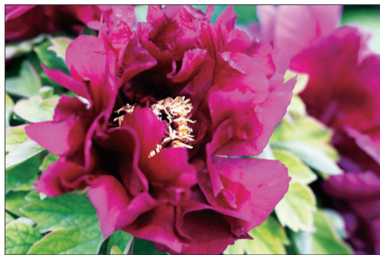
冠世墨玉，花墨紫色，丝绒瓣，色如黑缎，为黑色系牡丹中的佳品