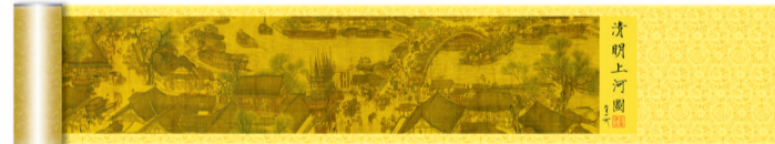
赠品:价值999元的清明上河图黄金卷(此图部分展示,全图更震撼)

价值剖析: 《清明上河图》是中国绘画史上的一座不朽丰碑,被后世尊为“中华第一神品”!它有着无与伦比的艺术价值和无法估量的文物价值;首次发行的“清明上河图金币”具有不可估量的艺术价值、投资价值和收藏价值 黄金白银是永恒财富,传世名画地位崇高无比,名画金币就是当之无愧的“国家宝藏”