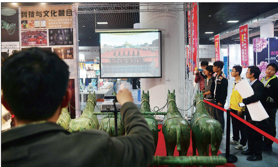
「天子驾六」体感游戏，让您穿越到隋唐洛阳城