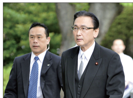
(右)参拜靖国神社 四月二十日,古屋圭司

安倍政权自上台以来,顽固推行美化日本侵略历史的右翼政策,包括安倍晋三本人在内,已有多名内阁成员悍然参拜靖国神社,招致国际社会强烈批评。