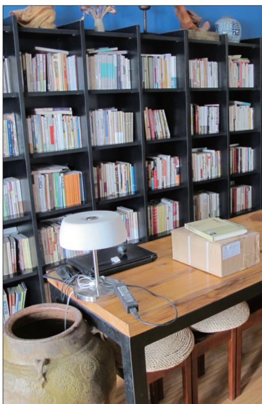
想象书店