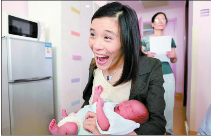
桑兰昨天上午抱着儿子露面,笑得合不拢嘴

产后不到10天,前国家体操队运动员桑兰就带着宝宝黄小宝出现在公众面前。昨日,桑兰在北京航空总医院举行了媒体见面会。这也是自2011年4月16日赴美打官司以来,桑兰首次出现在公众面前。