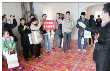
专业人士为业主讲解装修知识

在香港谷一装饰公司的样板间润中央广场,工作人员对水、电路工程,地面、墙面砖的铺设等问题向业主们作了细致的讲解。在建业·高尔夫花园的样板间,工作人员针对家装新型环保材料和新工艺的运用,专业精细的工艺进行了详细讲解,并且对业主们关心的装修预算进行了实例讲解。随后参观的香港谷一装饰公司店内,数名设计师一对一与业主交流,还利用多媒体对各个楼盘的样板间作了讲解。