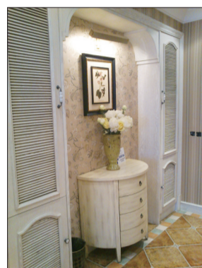
想有个兼顾实用与美观的玄关, 仔细看看我吧