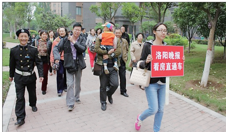
「看工地,学装修」 近百名业主走进建业高尔夫,一起

本报家居周刊“样板间的征集令”自3月20日开展以来,读者反响强烈,报名电话接连不断。大家对此次公益活动抱有极大兴趣,纷纷表示愿意参与其中。为了让参与活动的读者“眼见为实,放心装修”,经过严格筛选,《洛阳晚报·家居周刊》挑选了四家有实力、守信用的品牌装饰公司,举办业主“看工地,学装修”活动,免费为准备装修的读者开通直通车,让大家零距离接触家装施工现场。