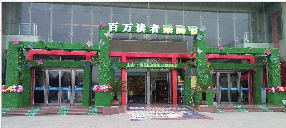
洛阳红星美凯龙A馆盛装以待