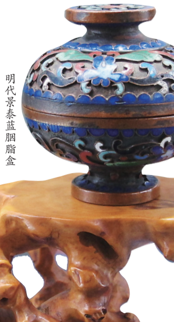
明代景泰蓝胭脂盒