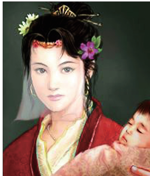
褚蒜子画像 (本版均为资料图片)