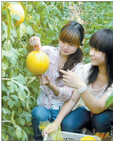
采摘西瓜 (资料图片)