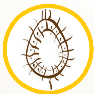
介壳(qi à o)虫