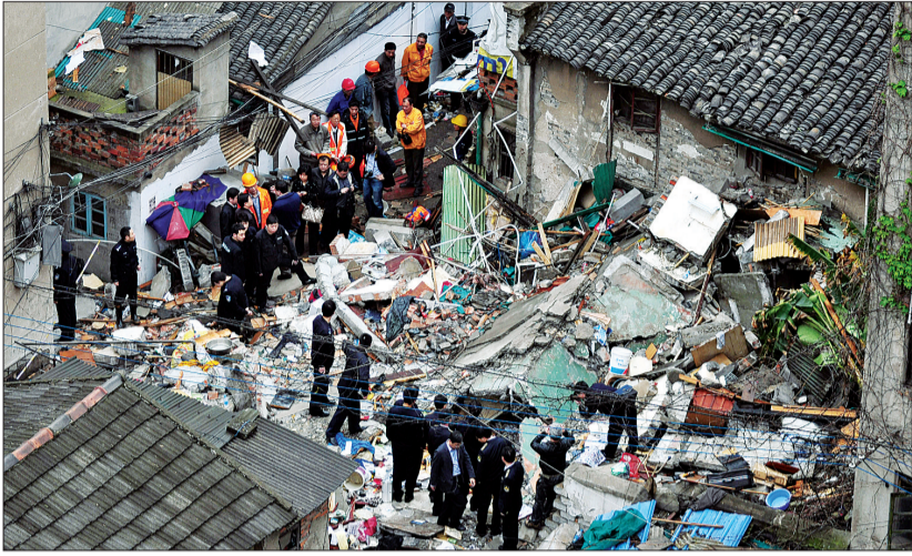
居民楼倒塌事故现场