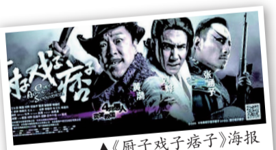
▲《厨子戏子痞子》海报