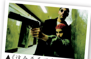
▲《这个杀手不太冷》海报