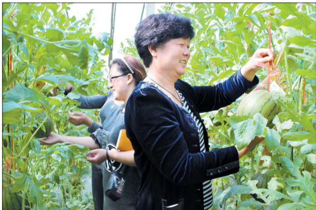
市民采摘袖珍西瓜