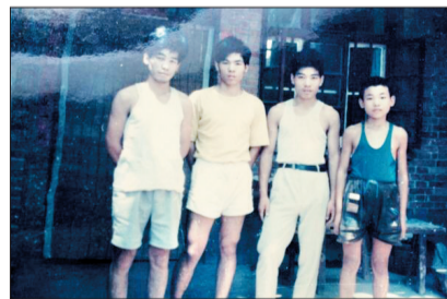
20多年前兄弟四人合影

地址：孟津县送庄开发区名特路 市内办事处：唐宫西路鑫源大厦A座1303室 电话：15896521568