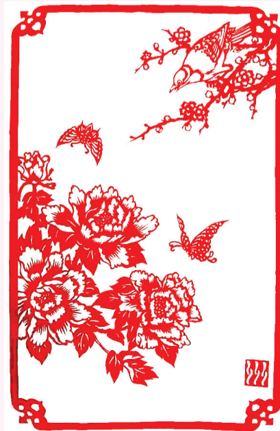
鸟语花香(剪纸) 郭艺洲 七十六岁 瀍河回族区