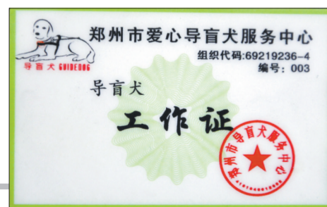
导盲犬要持证上岗