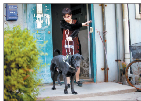
遇到台阶,强尼会停顿片刻提醒主人