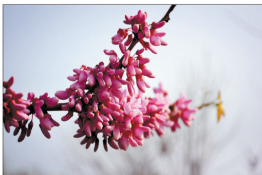
●名称:紫荆 ●拍摄时间:4月底 ●拍摄地点:隋唐城遗址植物园 ●花语:亲情 (线索奖30元)

读者和网友可把拍摄的花儿照片发送到晚报微信公众平台,同时附上拍摄时间和地点等文字信息。特别提醒,图片应为jpg格式,确保清晰。