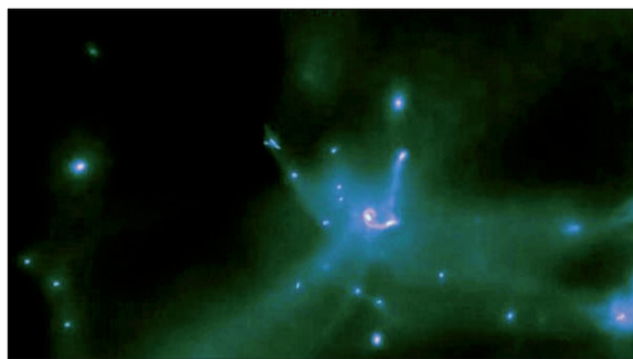
大爆炸后五十亿年的宇宙形态 (资料图片)

空状态下分散在各地神秘的暗物质。几百万年过去了,暗物质集中起来,为早期星系的产生埋下种子。反暗物质随之出现,才有了将来的星球和生命。