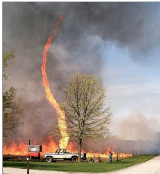
这名美国女子拍到的“火焰龙卷风”