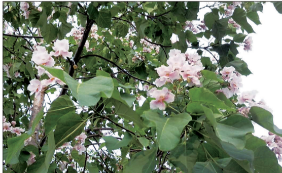
●名称:猥实 ●拍摄时间:5月初 ●拍摄地点:建设路 (线索奖30元)