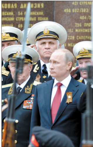
五月九日，在克里米亚塞瓦斯托波尔港，普京与二战老兵一起检阅仪仗队

俄罗斯黑海舰队驻扎地塞瓦斯托波尔9日举行阅兵式，纪念卫国战争胜利69周年和塞瓦斯托波尔从德国