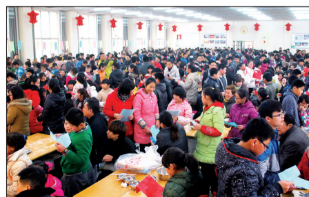
建中学校第四届饺子文化节