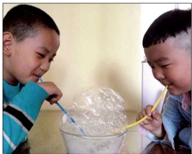
欣小朋友和小伙伴在吹泡泡

瞧,玻璃碗的碗壁是一大看点哟!欣小朋友和小伙伴一起观察了紧贴碗壁的泡泡,这些泡泡竟然是由一个个六边形构成的,跟大家常见的