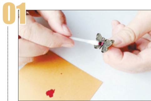
用棉签蘸指甲油,将蝴蝶的身躯涂成红色。

准备材料: 不同颜色的指甲油、棉签、牙签、旧首饰。选一样你想改造的旧首饰,最好是颜色相对单一的。再根据你的创意,挑选不同颜色的指甲油。我们选用的是一款复古蝴蝶耳环,有旧金属的质感。指甲油选的是蒂芙尼色和大红色。