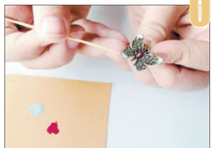
因为蝴蝶翅膀处的纹路较细,所以选用牙签蘸蒂芙尼色的指甲油,细心地涂抹翅膀的上下两个角。