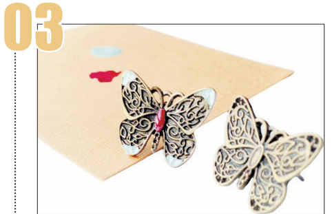
等指甲油干后,一只新颖的耳环就诞生啦。用同样的方法涂抹另一只,耳环就被改造完毕了。是不是有了另一种味道呢? (银玲 马焱)

请爸爸妈妈将宝宝瞬间的美好时光展示出来吧,让我们一同分享你们的快乐。欢迎把照片和相关信息送到 aoe 儿童摄影艺术馆。