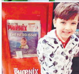
▲网络红人小胖现已结婚 ▲外国励志小萌娃变身可爱小正太