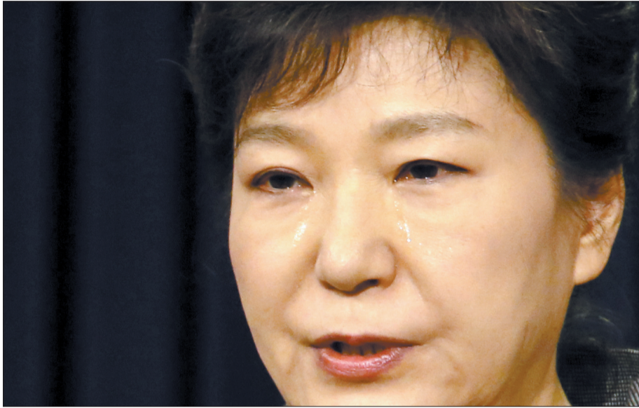
流泪 五月十九日，韩国总统朴槿惠在发表电视讲话时