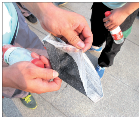
假的活性炭空调滤芯