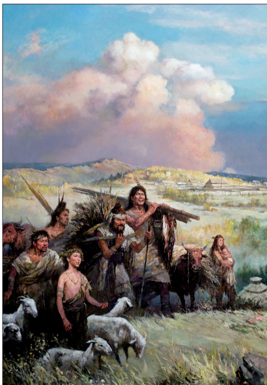
文明曙光二里头 (油画)

洛水汤汤,流经一个叫二里头的地方。此地夏王朝称斟鄩,而这一带自古又称洛汭。汭,水流汇合或弯曲处。世界文明的起源总在大河之畔,洛汭,是中国文明主要的源头之一。