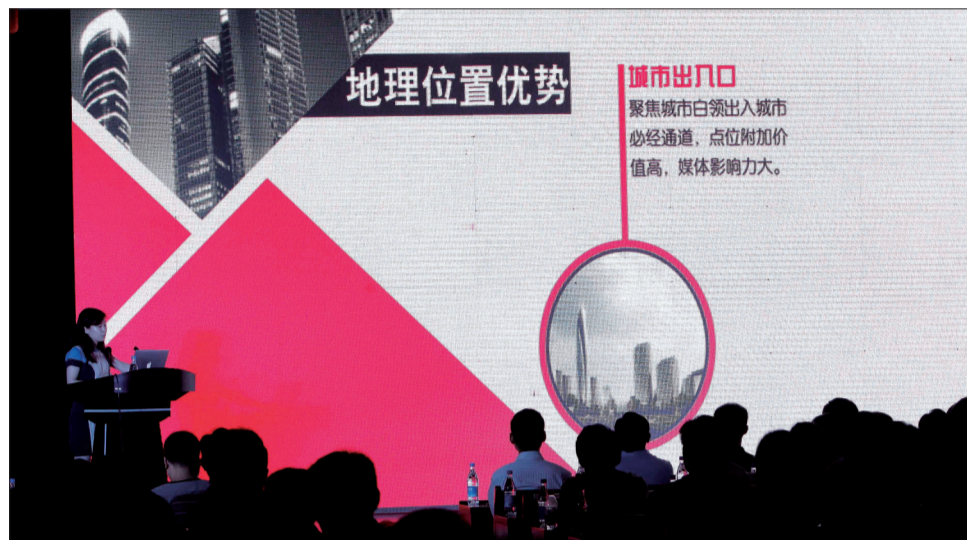
洛阳城市LED联播网正式开播