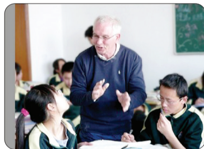
河南枫叶国际学校初中外教课堂