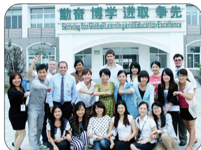
河南枫叶国际学校英语中心教师团队