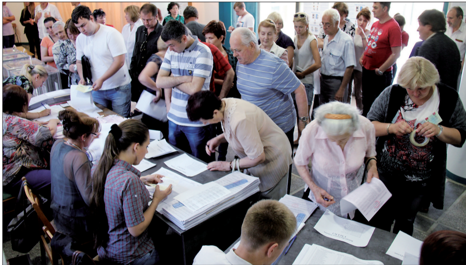
25日,在乌克兰敖德萨市的一家投票站,选民排队登记

波罗申科呼吁选民为他投票,让他在首轮选举中直接胜出。他暗示,鉴于乌克兰安全局势不断恶化,第二轮选举可能无法顺利举行。