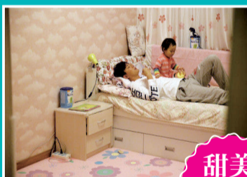
两岁半奥莉的房间

如果您有类似的小心思，可又不知道如何将它顺利实施，或者您期待听一听专业人士对小孩房间装修的具体建议，那么本期《洛阳晚报·家居周刊》推出的“致童年——为孩子的童真岁月筑个家”报道，绝对符合您的“胃口”。一起来“尝尝”吧！