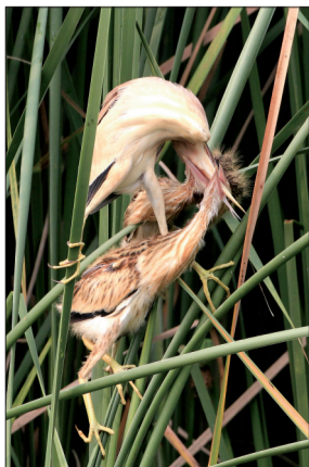
黄苇鹈(ji ā n)瑜伽式喂食