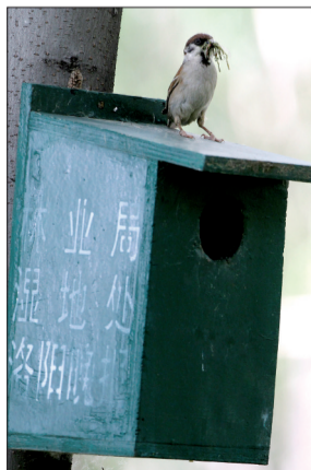
麻雀叼着虫子回到巢箱