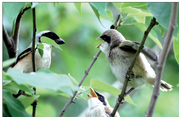
棕背伯劳的幼鸟在树枝上“乞食”