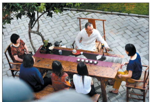
茶人为茶客斟茶献艺