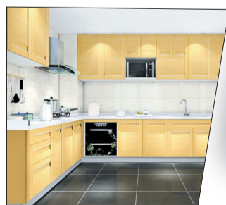
(本版图片均为资料图片)