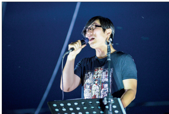
麦浪音乐节上的摇滚乐队主唱

会盟镇光瑞美好乡村位于207国道与314省道交叉口北500米处。14日、15日的19时至20时30分,音乐节将继续安排乐队表演。