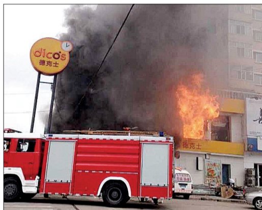
▲ 爆炸案现场冒出滚滚浓烟 ▲ 消防队员到场扑救大火