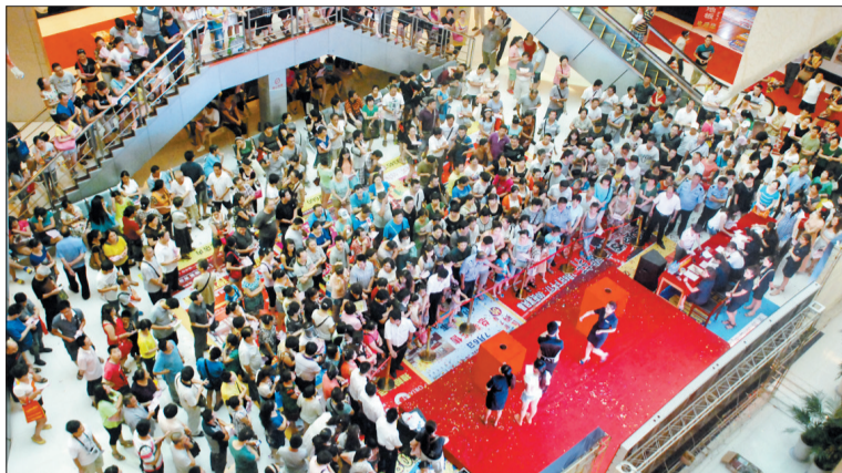
金梦家居任意店活动抽奖现场(资料图片)

自6月14日起,金梦家居的顾客只需支付30元,即可获得《爱心惠民册》一本。顾客持《爱心惠民册》在金梦家居上海市场店、广州市场店收银台单笔实际交款金额在3000元以上,即可享受全场非冠名品牌成交价后立减300元的优惠。《爱心惠民册》限量发售1000本。