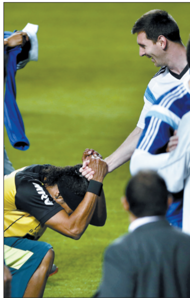
“小罗”(左)和梅西握手致意