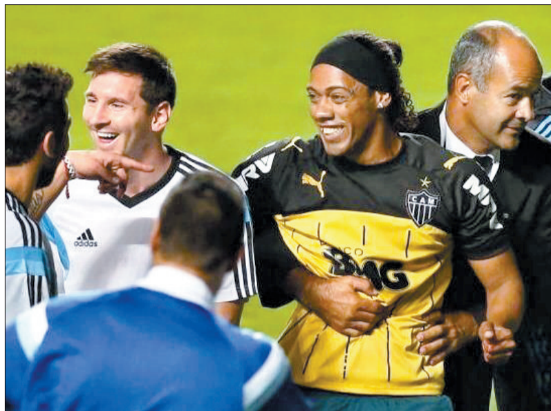
“小罗”(右二)把梅西(左二)和安保人员都逗乐了