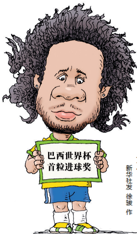
乌龙 新华社发 徐骏作

西班牙、荷兰的冠亚军重演，最好的心照不宣，是各取一分。那样的话，世界杯可真就变得索然无味开场，互联网时代的世界杯，看来注定远离经典！