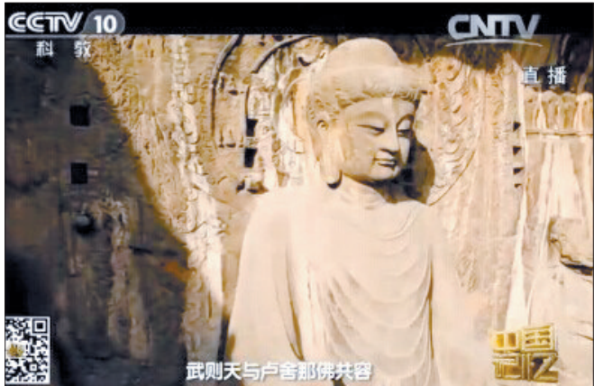
节目中的龙门石窟