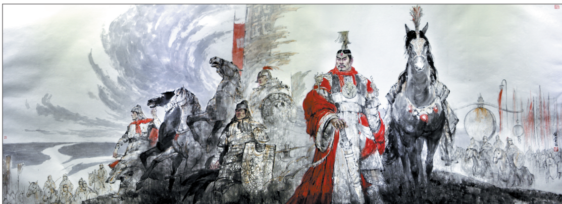
汉光武帝中兴(油画)

建武元年(公元25年)10月18日,汉光武帝刘秀率大军进入洛阳,举行盛大定都仪式,史称东汉。自此,东汉王朝历12帝,196年。