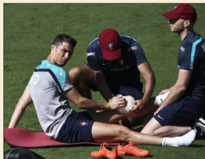
C罗训练后腿敷冰块

对于外界关于C罗将因伤告别世界杯的传言,葡萄牙门将贝托予以否认:“虽然C罗在今天早些时候的训练课上提前退场,但无论从身体上还是从心理上来说,他目前的状态都是100%的。”