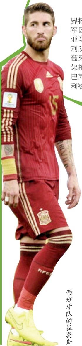
西班牙队的拉莫斯

1966年英格兰世界杯,贝利率领的“桑巴军团”首战击败保加利亚队,第二场输给匈牙利队,最后一轮遭遇葡萄牙队,贝利受伤被担架抬着离场,卫冕冠军巴西队无奈接受1:3失利被踢出局。