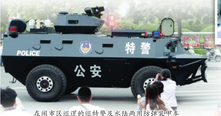
在闹市区巡逻的巡特警及水陆两用防弹装甲车