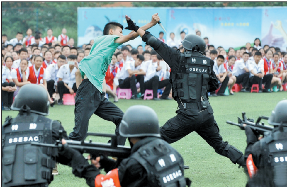
校园反恐防暴队演习现场 (网络图片)