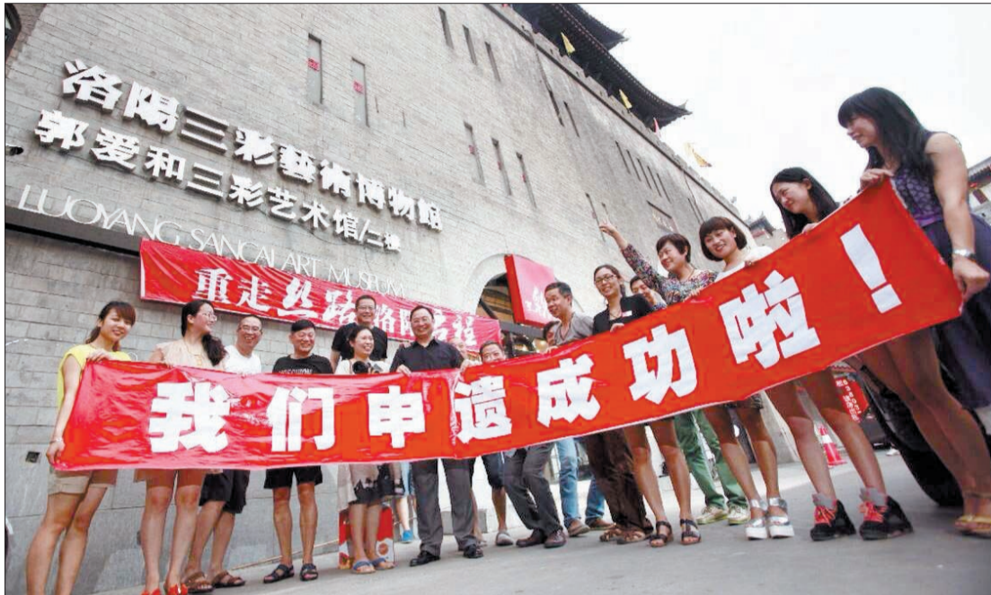
热心市民和网友齐聚丽景门庆祝