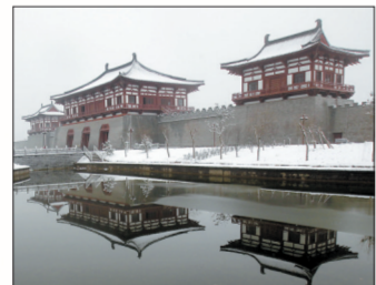
■ 隋唐洛阳城定鼎门遗址

崤函古道是东京洛阳至西京长安进入古陕州崤山地段道路的总称,是中原通关中、达西域的咽喉要道,也是丝绸之路的干线路段。现存的崤函古道石壕段遗址位于陕县硤石乡车壕村东南800米处的金银山麓,呈西北东南走向,全长约230米。