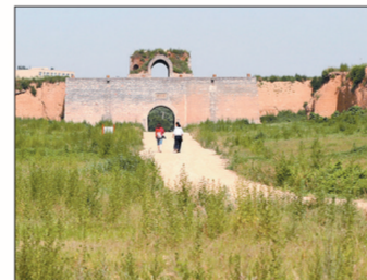
■ 新安汉函谷关遗址

汉魏洛阳城遗址是公元1世纪至6世纪丝绸之路的东方起点,是东汉、曹魏、西晋、北魏四朝原址沿用的都城遗址。遗址西距洛阳市区约15公里,现存格局及遗迹以北魏时期为主,同时分布的有西晋、曹魏、东汉以及更早时期的遗存。遗存主要包括东汉至北魏时期的城址(北魏内城)及宫城城墙、城门、城壕、道路、水系、建筑遗址(包括宫殿、衙署、寺院、仓库等)、手工遗址等。