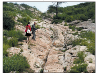
■ 崤函古道石壕段遗址

崤函古道是东京洛阳至西京长安进入古陕州崤山地段道路的总称,是中原通关中、达西域的咽喉要道,也是丝绸之路的干线路段。现存的崤函古道石壕段遗址位于陕县硤石乡车壕村东南800米处的金银山麓,呈西北东南走向,全长约230米。